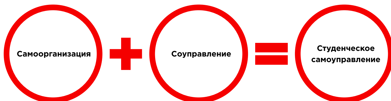
Рисунок 1. Элементы студенческого самоуправления

в процессе деятельности в структурах студенческого самоуправления. Для системы ССУ в организациях СПО в большей степени подходит понятие «соуправление» — совместная деятельность студентов и сотрудников образовательной организации в вопросах реализации полномочий ССУ по управлению образовательной организацией. Схематично это можно представить так: