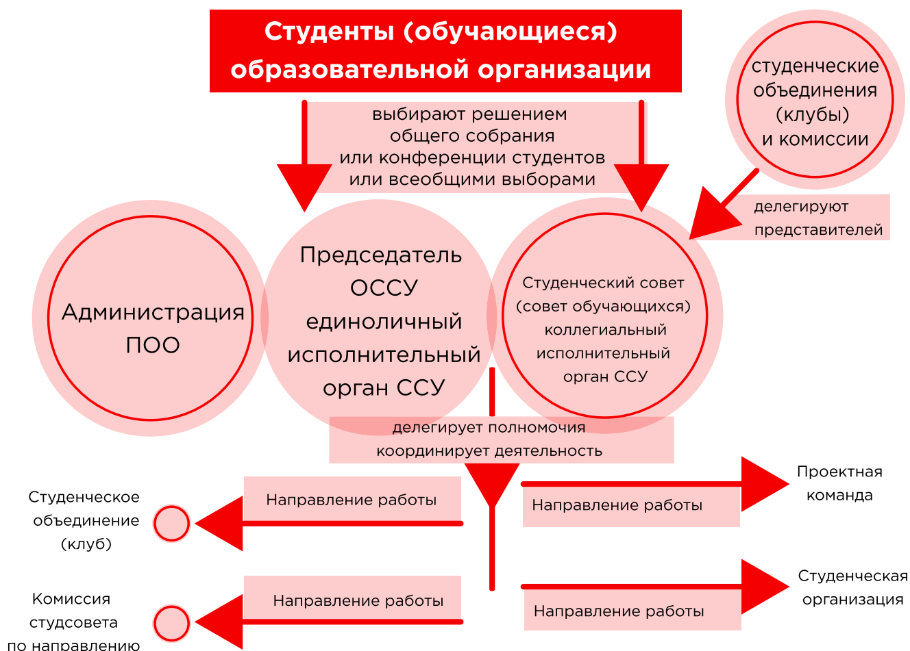
Рисунок 3. Структура студенческого самоуправления

Когда количество членов студенческого совета ограничено количественным составом, определенным на конкретный период (учебный год), а планов и вновь прибывающих задач становится все больше, увеличивается риск снижения эффективности работы студенческого самоуправления. Сам студенческий совет должен заниматься выработкой решений, инициировать проекты и становиться площадкой для переговоров организаторов мероприятий в студенческом сообществе.